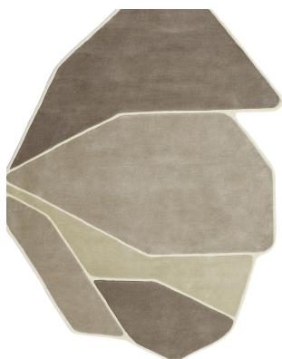
RE 01 Lunar Gravel

Disponibile su misura Custom sizes available